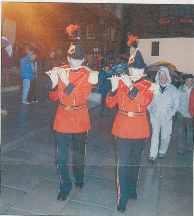
Zwei Pfeifer zu Beginn der Inszenierung.

Die Zürcher Szenografinnen Schumacher und Wegmann brillieren mit einer mystischen Welt