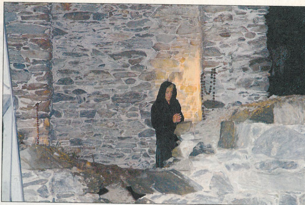
Eine Frau, die Busse tut.