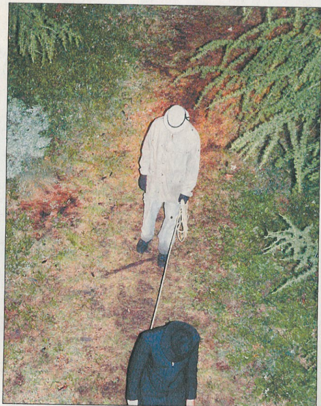
Arme Seelen wandeln durch den Wald.

Interessen: Musizieren, Tanzen, Nähen, Wandern, Wintersport, Reisen.